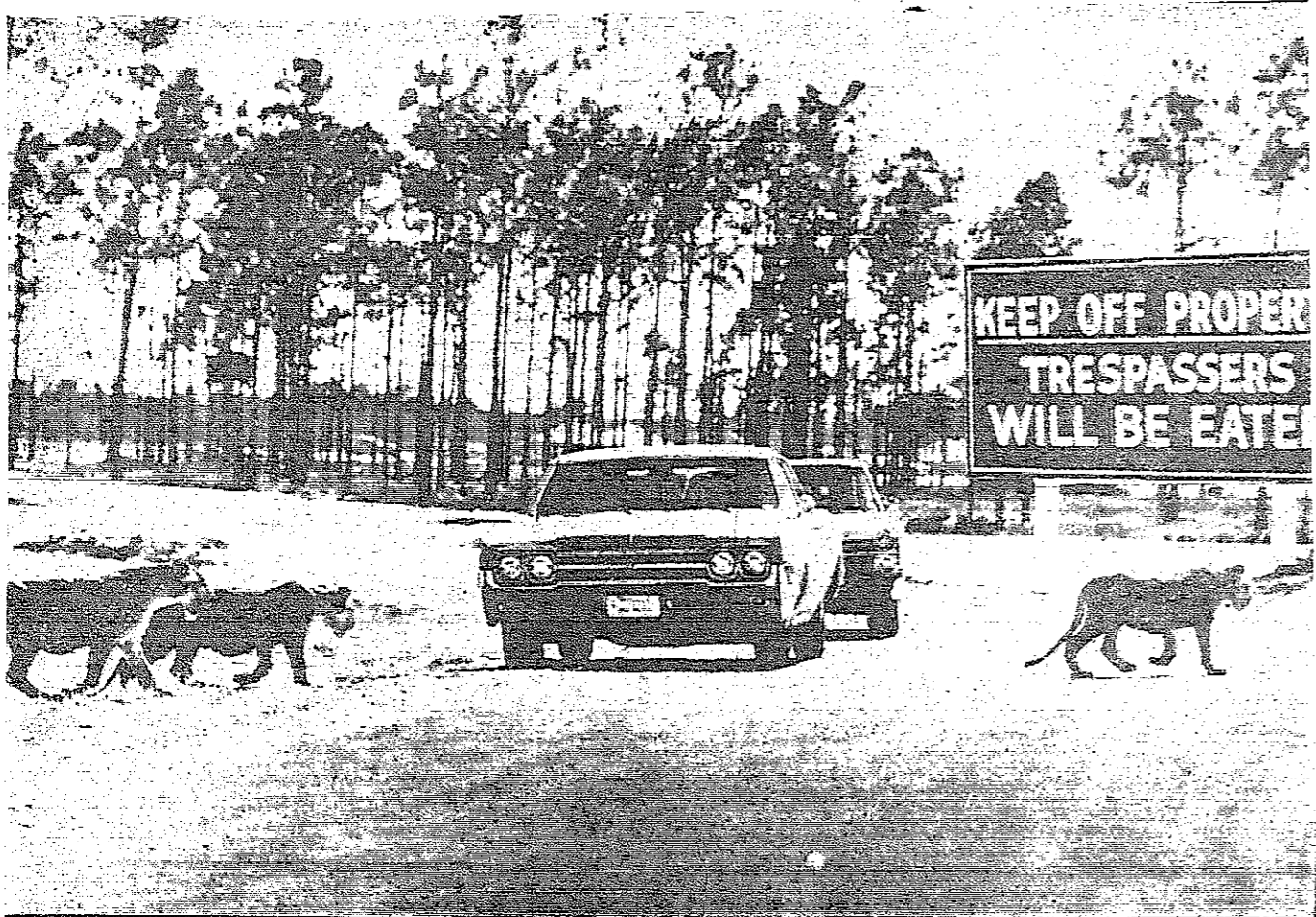
في هذه (الغابة الاستوائية) التي اقيمت على ساحل ولاية فلوريدا بالولايات المتحدة، تتحول الثور والاسود في حرية تامة. ويح للناس قيادتهم في داخل الغابة، شريطة الا يتجولوا منها، (والا اكلوا) كما يقول الاعلان اظاخر في الصورة